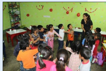
1) UNA CLASE DE EDUCACION FISICA. 2) LECTURA EN LA BIBLIOTECA 3) APRENDIZAJE DINAMICO EN CLASE.